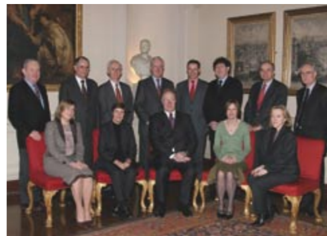
Na Rannpháirtigh 6 ag an Naoú Irish European Law Forum Bliantúil i Teach Newman, Nollaig 2005

Rinne OSFC seachadadh ar 58 gcinn de láithreorachtaí i 2005 os comhair lucht éisteachta de níos mó ná 3,000 áirithe ina iomláine. Tá na mionsonraí in Aguisín 1.2.1 den Tuarascáil. Is cuid tábhachtach na láithreorachtaí seo d'iarrachtaí an OSFC géilliúntais i leith ceanglais dlí cuideachta Éireannaí a chur chun cinn. Ghlac stiúrthóirí cuideachta go fonnmar le láithreoracht na hOifige ar theideal dó "Corporate Health Check" inar tugadh